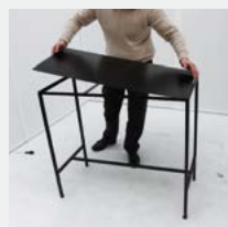
Installation du plancher.