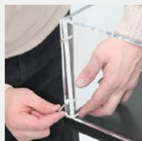
Assemblage du capot vissé (après avoir retiré le film de protection).