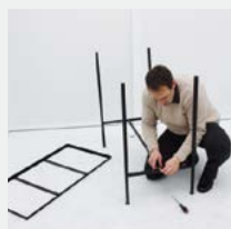
Assemblage de la barre de renfort.