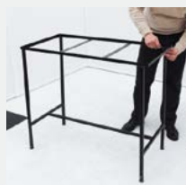
Verrouillage de la structure à l'aide de 4 vis.